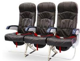
ที่นั่งมาตรฐาน

ที่นั่ง Hot Seat ที่มาพร้อมกับที่วางที่มากกว่าที่นั่งมาตรฐาน. ด้วยที่วางขาที่กว้างเป็นพิเศษ. คุณจึงมีพื้นที่พอที่จะสามารถยืดขาได้อย่างเต็มที่. นอกจากนี้. คุณยังมีสิทธิ์ขึ้นเครื่องก่อนใคร. ต้องการเดินทางด้วยความเงียบสงบไหม้. อย่าลืมจองที่นั่ง Hot Seat ล่วงหน้าบริเวณโซนปลอดเสียง.