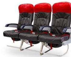
ที่นั่ง Hot Seat

พบประสบการณ์สุดหรูไปกับที่นั่งพรีเมียมแพลตฟอร์มที่นั่งระดับรางวัลชนะเลิศ ที่นั่งพิเศษนี้สามารถปรับเอนราบได้มากกว่าที่คุณต้องการ และยังมีไปถึงอุปกรณ์อื่นๆ ที่ช่วยให้คุณเดินทางไปด้วยความสะดวกสบายได้อย่างเต็มที่. คุณยังได้รับบริการเสริม มากมายเมื่อเลือกที่นั่งพรีเมียมแพลตฟอร์มในเที่ยวบินของแอร์เอเชียเอ็กซ์.