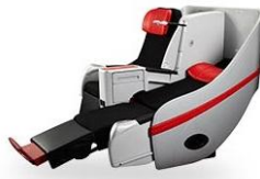
ที่นั่งพรีเมียมแพลตฟอร์ม

ที่นั่งพรีเมียมแพลตฟอร์ม ที่นั่ง Hot Seat ที่นั่งมาตรฐาน โซนปลอดเสียง ประตูทางออก ที่นั่งทารก ห้องน้ำ